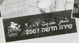
שירה חדשה 2007