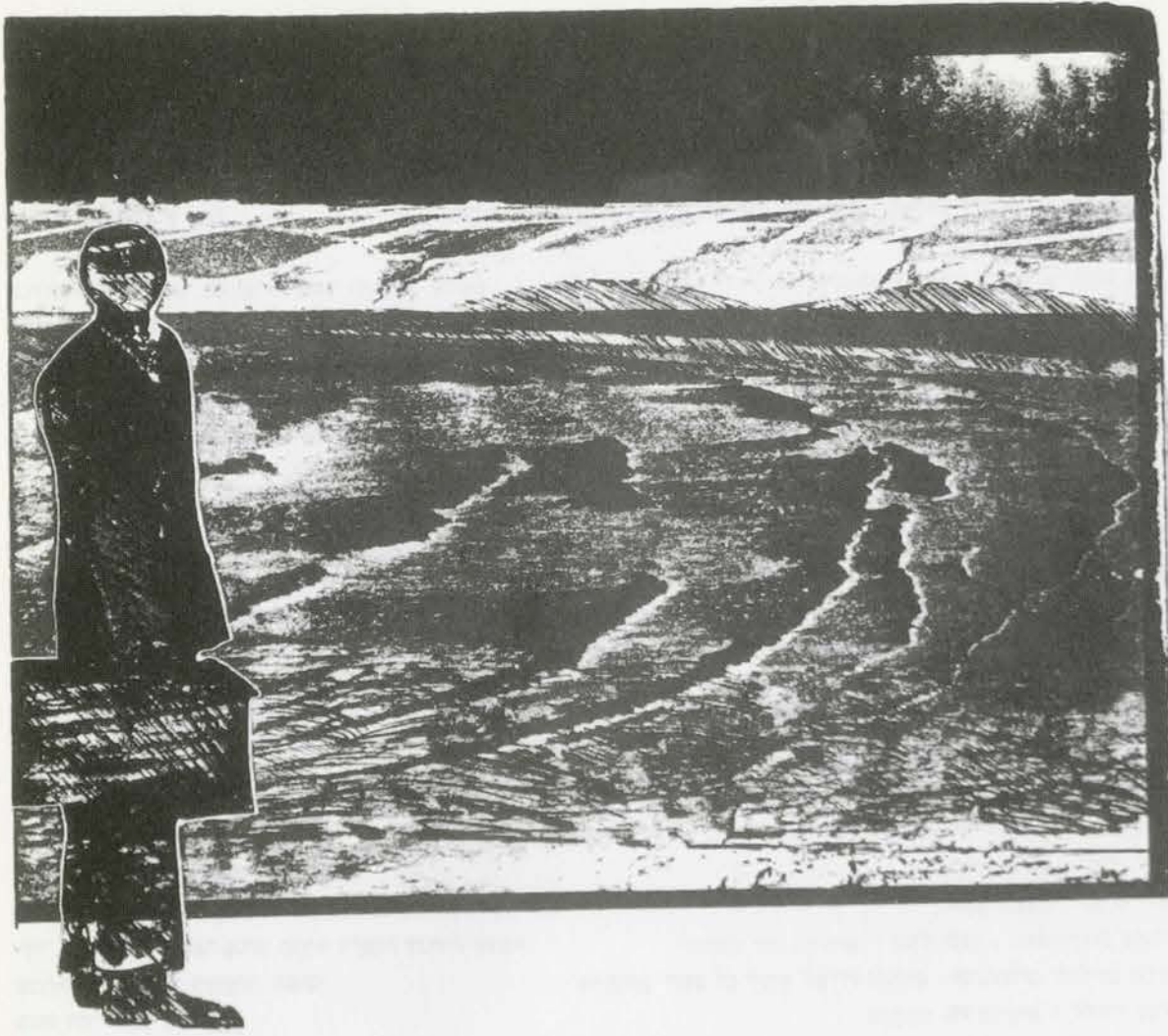
פנחס כהן־גן, דמותיים, צריבה על צילום, 59x78 ס"מ, 1971